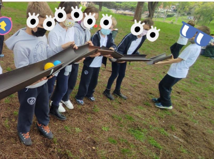
“AVVENTURE IN NATURA”