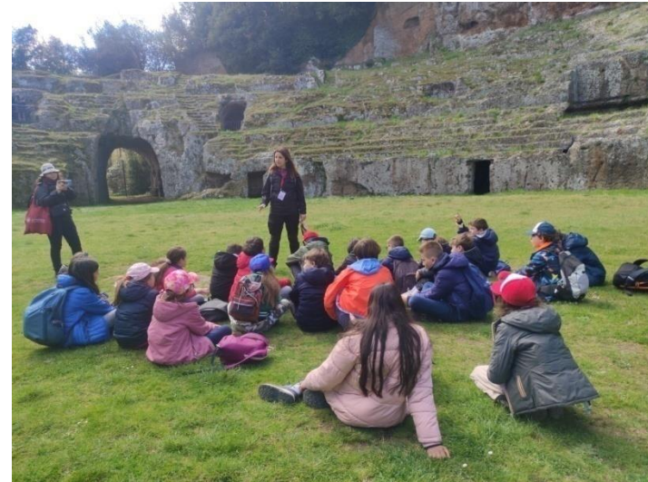
“STORIA & NATURA”